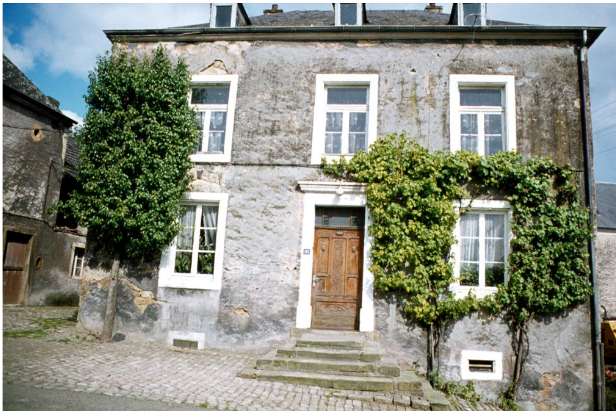
Wohnhaus: südliche Hauptfassade