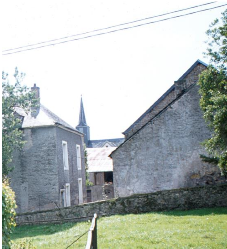
Ehemals getrenntes Wohn- und Scheunengebäude: nördliche Rückseite