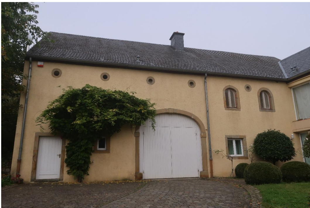
Ehemalige Scheune: östliche Hauptfassade