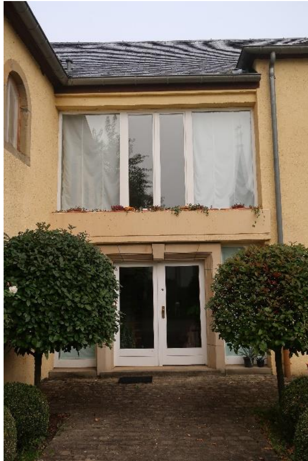
Neuer Eingangsbereich als Verbindungselement zwischen Wohnhaus und ehemaliger Scheune: südliche Hauptfassade