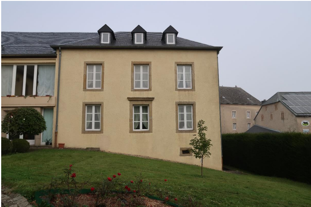
Wohnhaus: südliche Hauptfassade