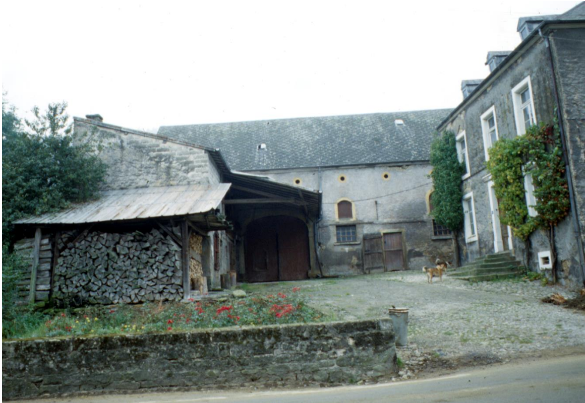
Scheune: östliche Hauptfassade