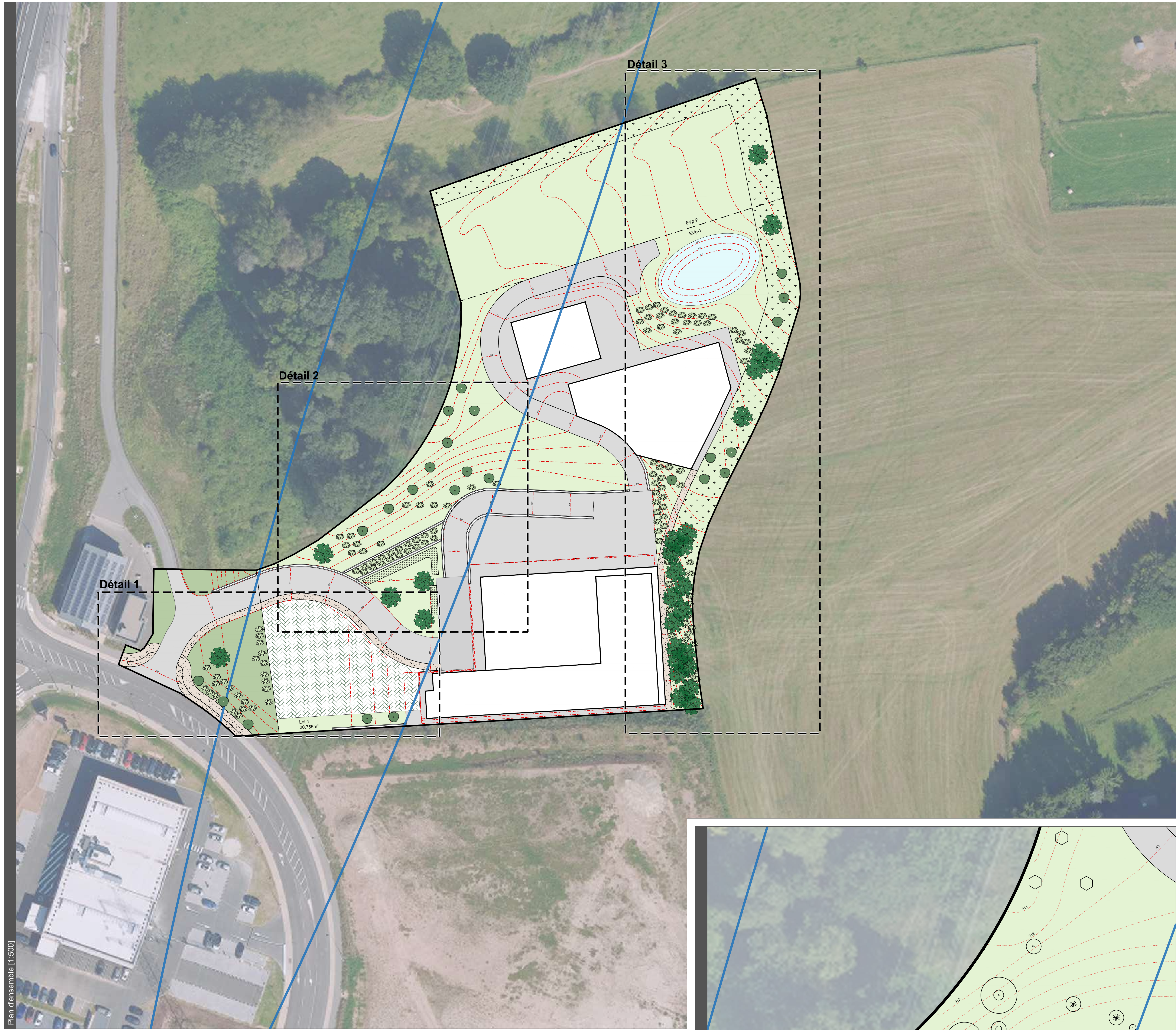
Plan d'ensemble [1:500]