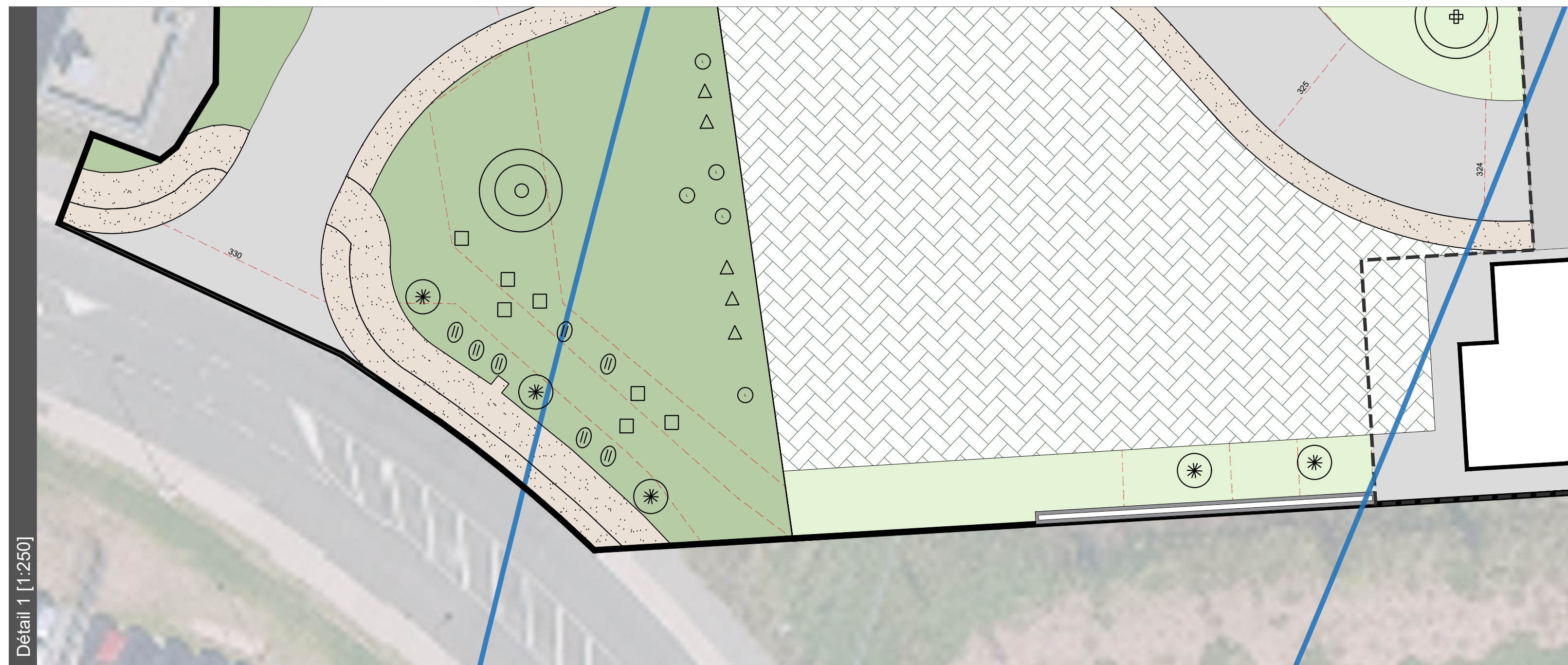
Détail 1 [1:250]